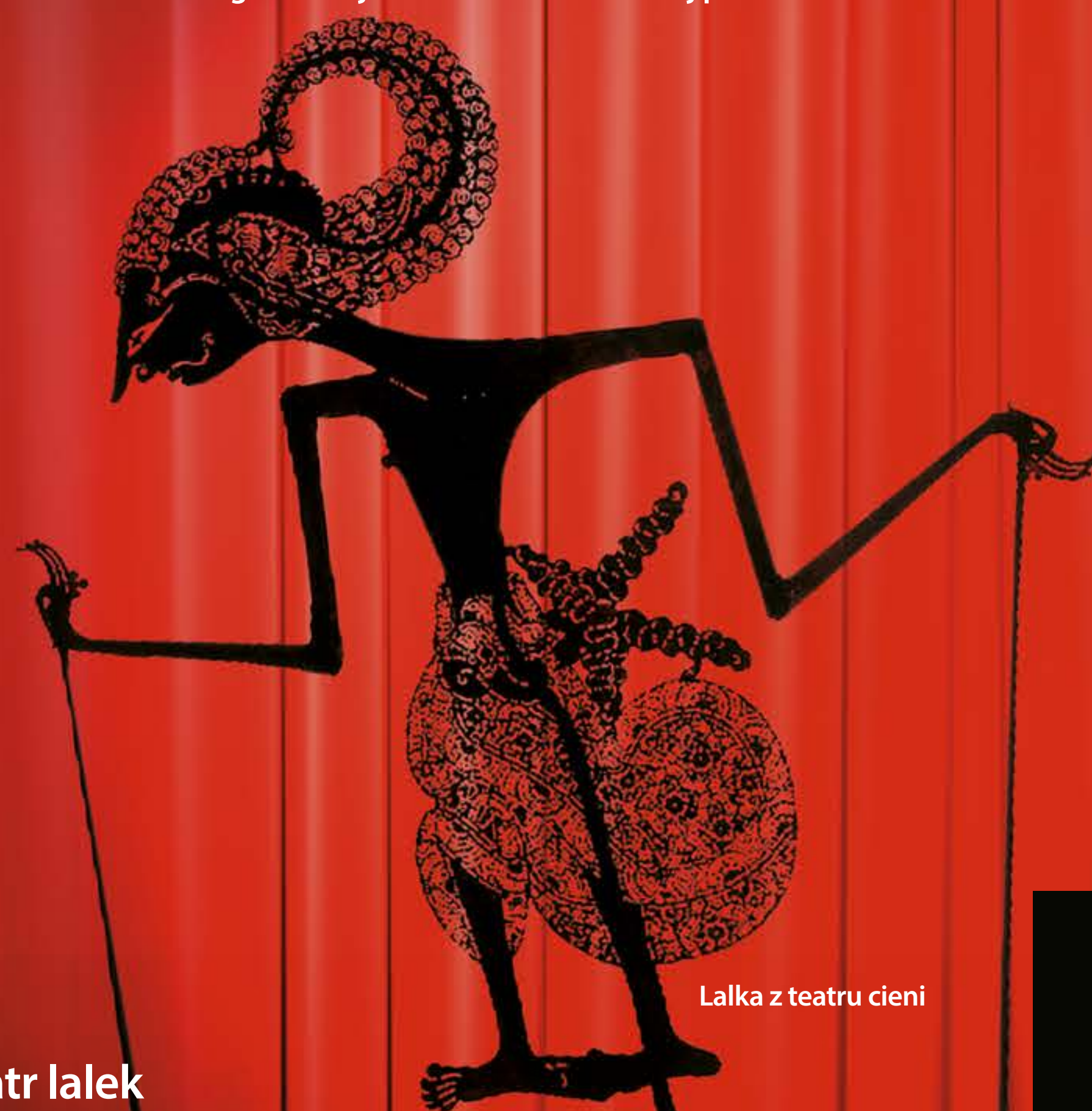
Lalka z teatru cieni

– widowisko wkraczające w powszednie życie miasta, wykorzystujące skwery, parki, ulice, place itp. Jego celem jest dotarcie do szerokiej publiczności.